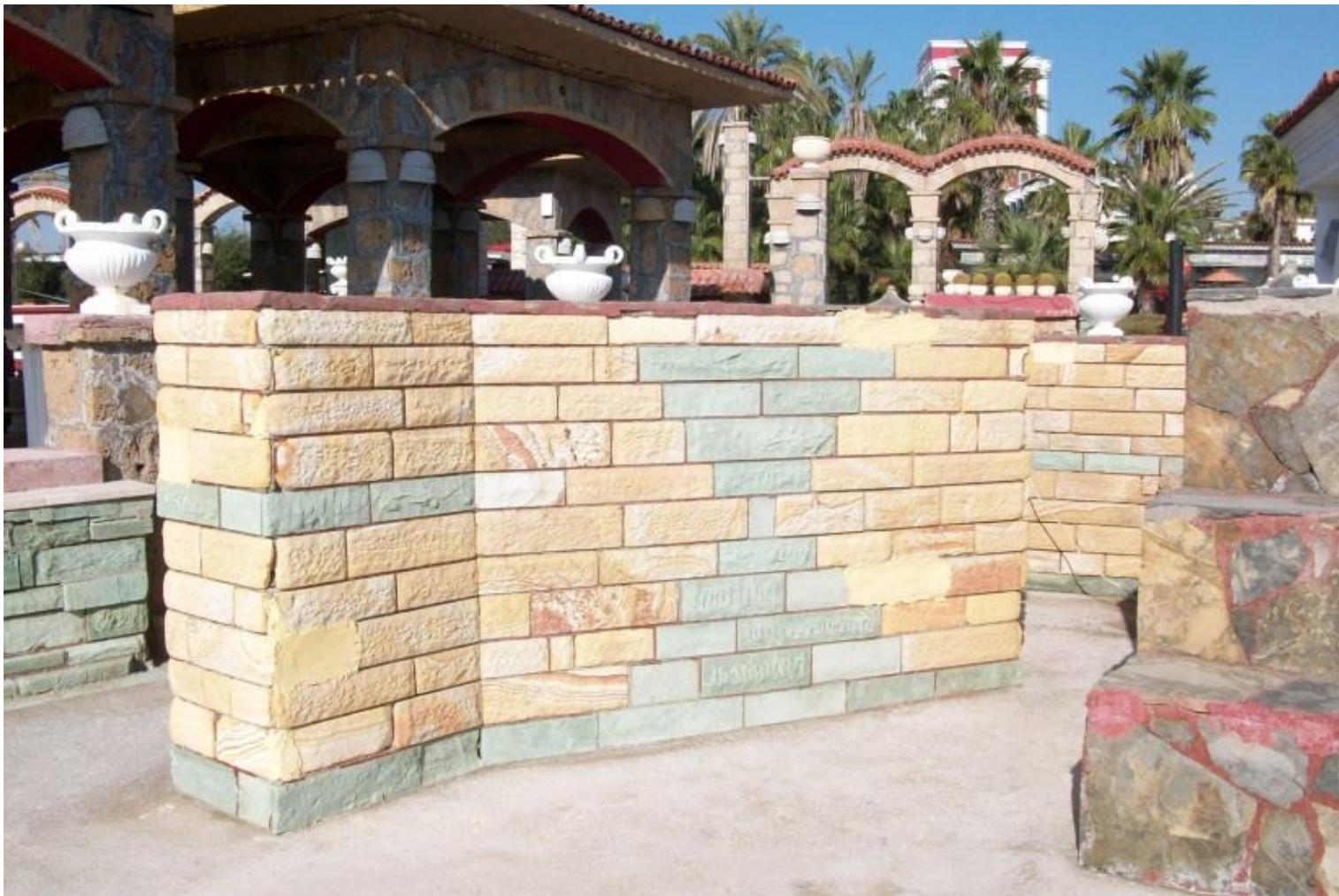
Декорации на арках