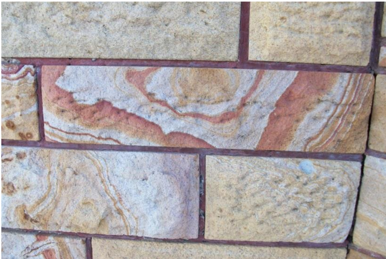
Декорации на арках