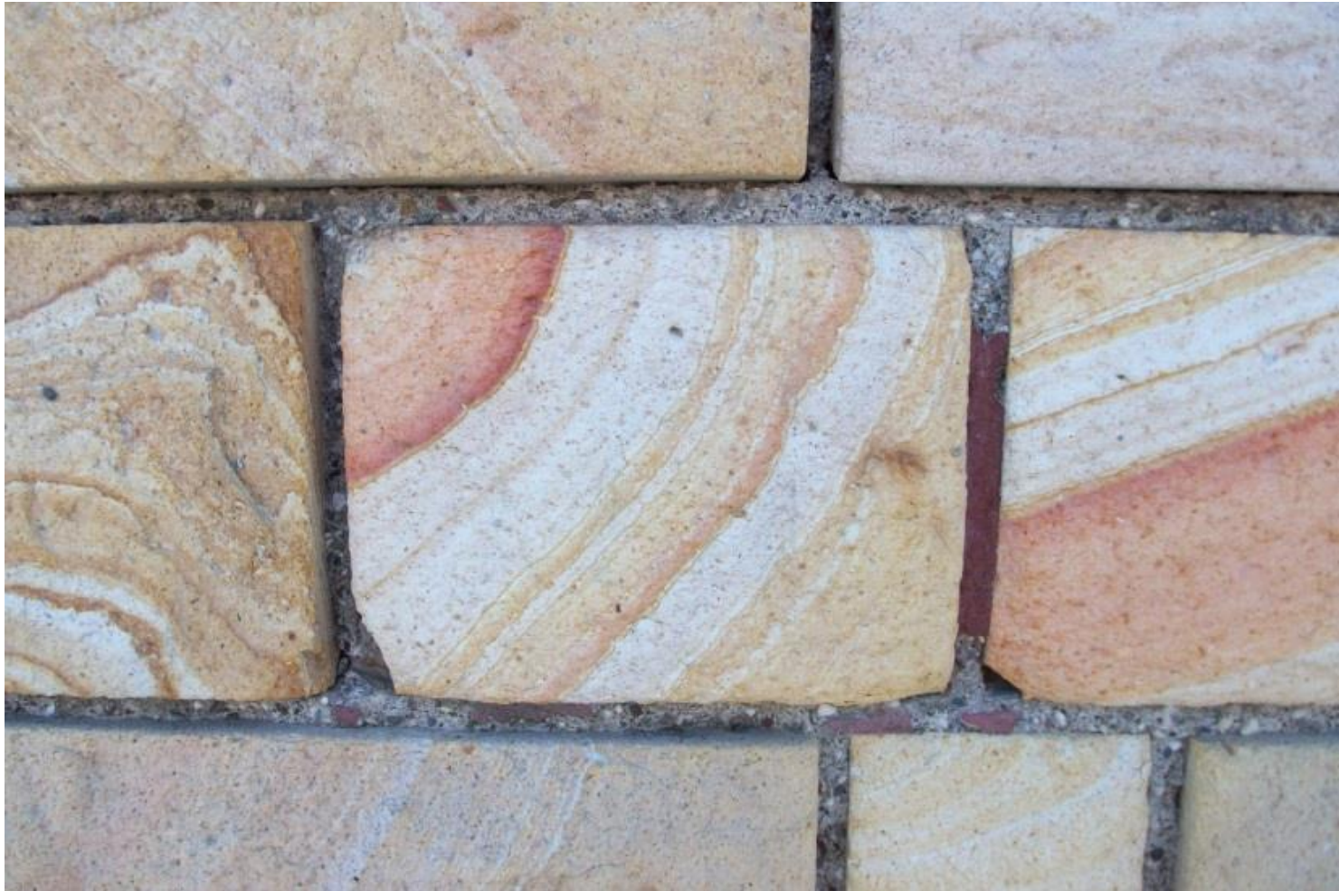
Декорации на арках