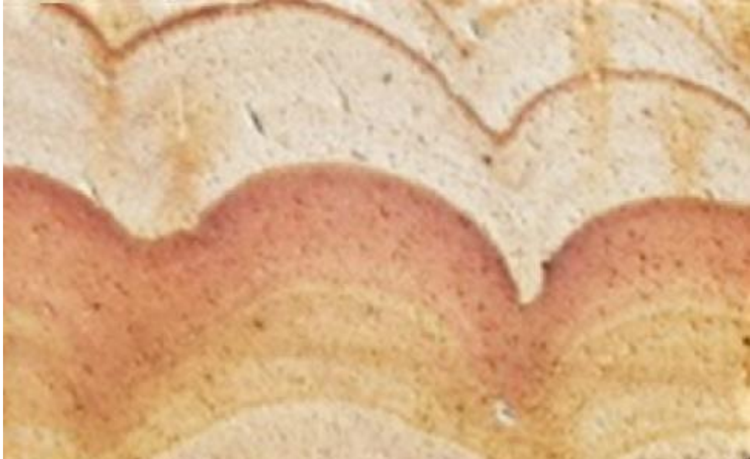
Метод изолиний с послойной окраской