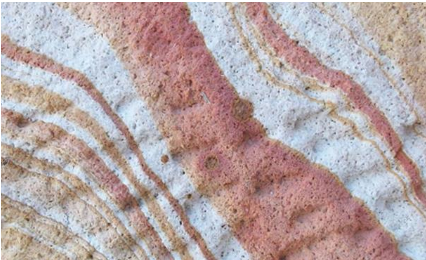
Метод изолиний с послойной окраской