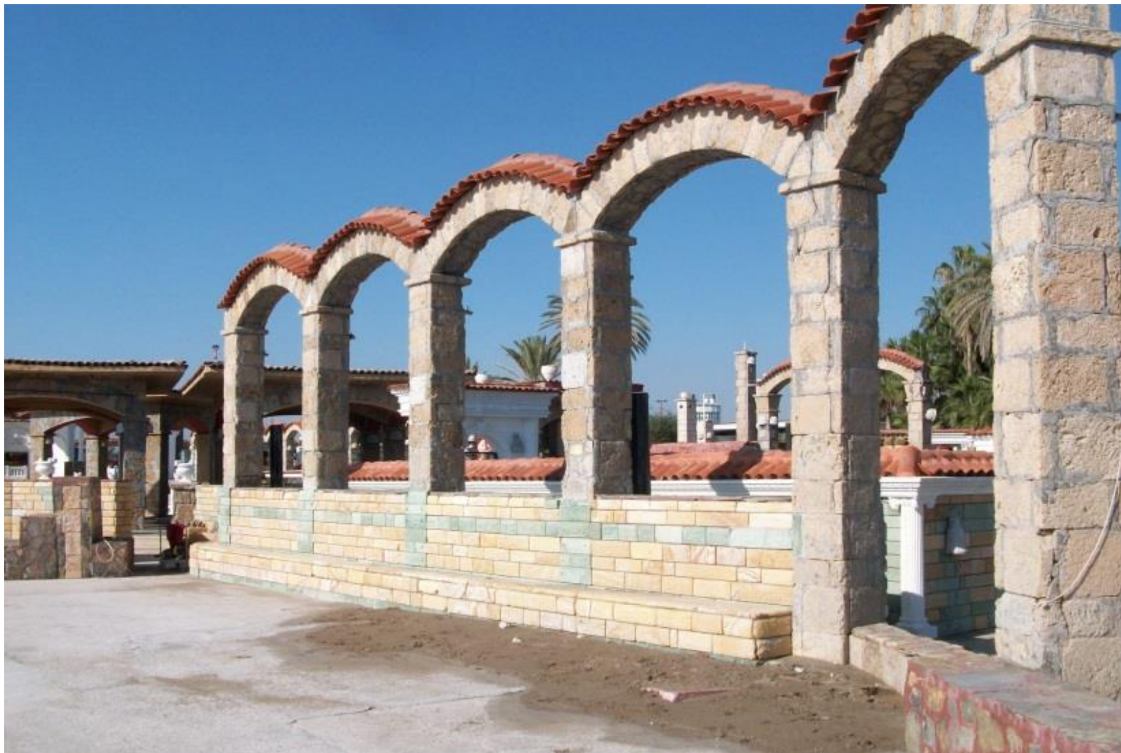
Декорации на арках