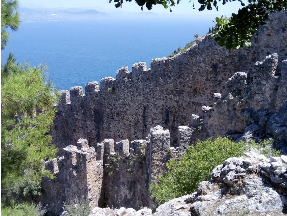
Ein Teil der alten Festungsmauer