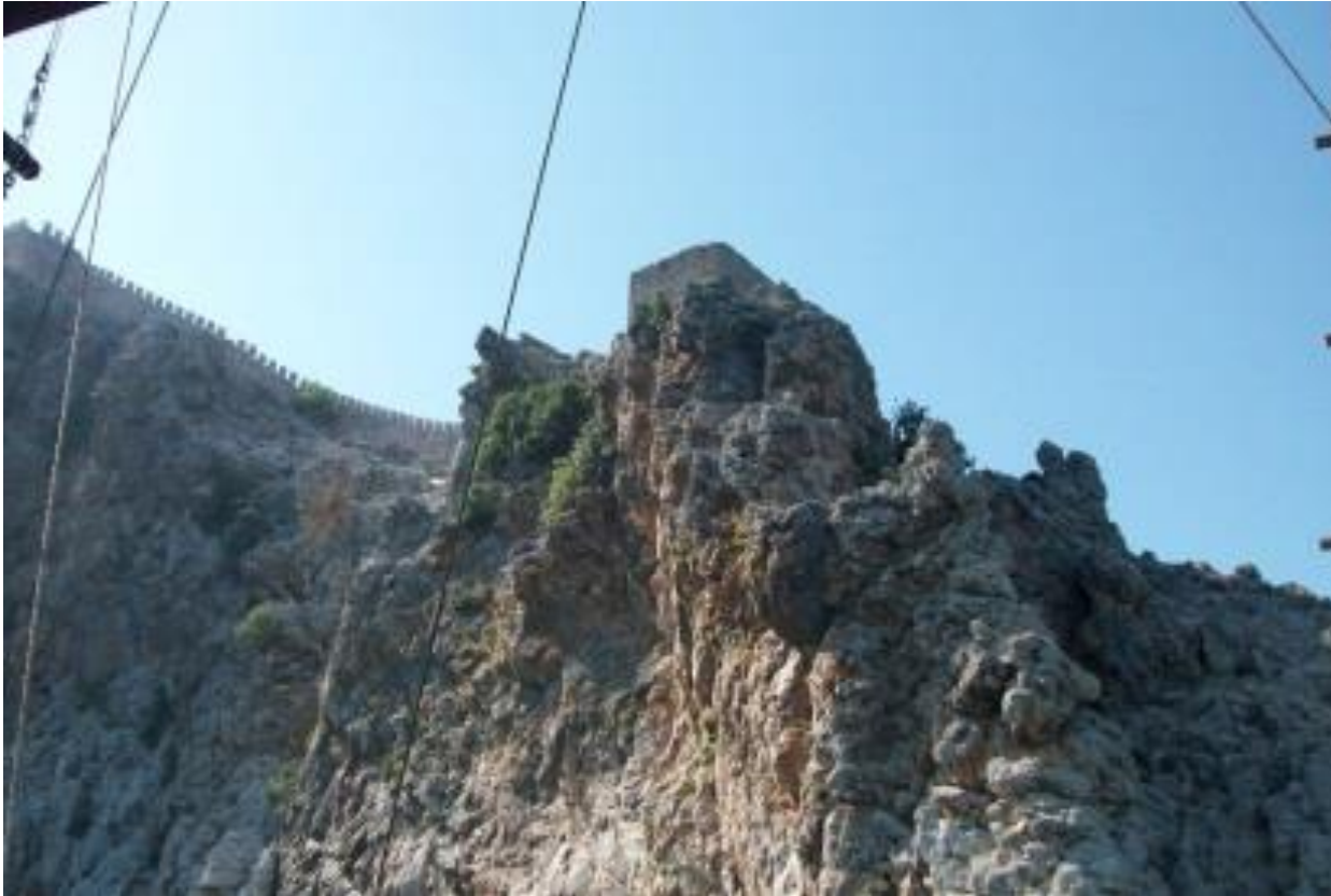
Blick auf die Burg-Mauer