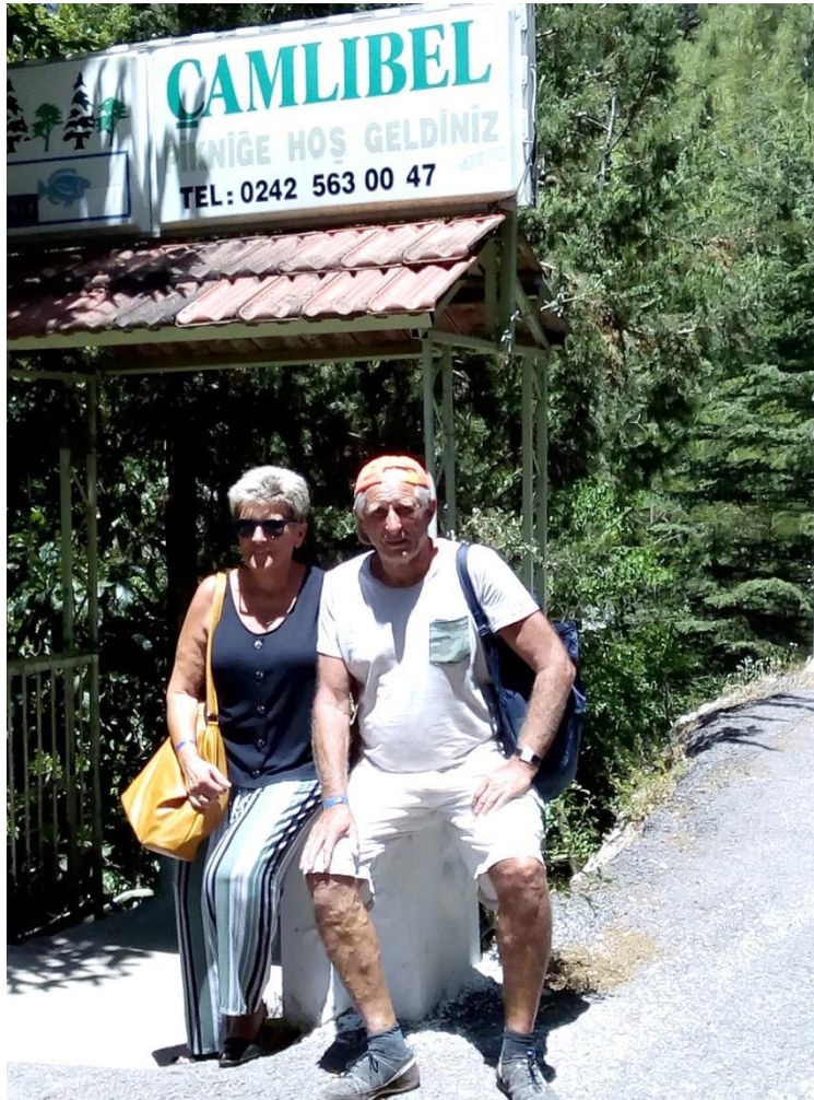
Die Autoren am Camlibel Picknick