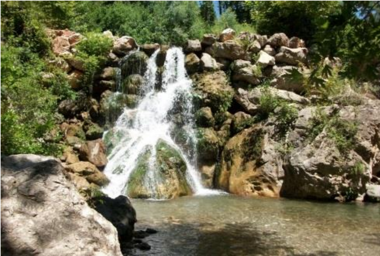
Der Wasserfall in Canyon