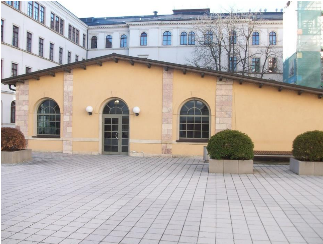
Das Alte Heizhaus im Innenhof des Hauptgebäudes der TU Chemnitz, Straße der Nationen 62