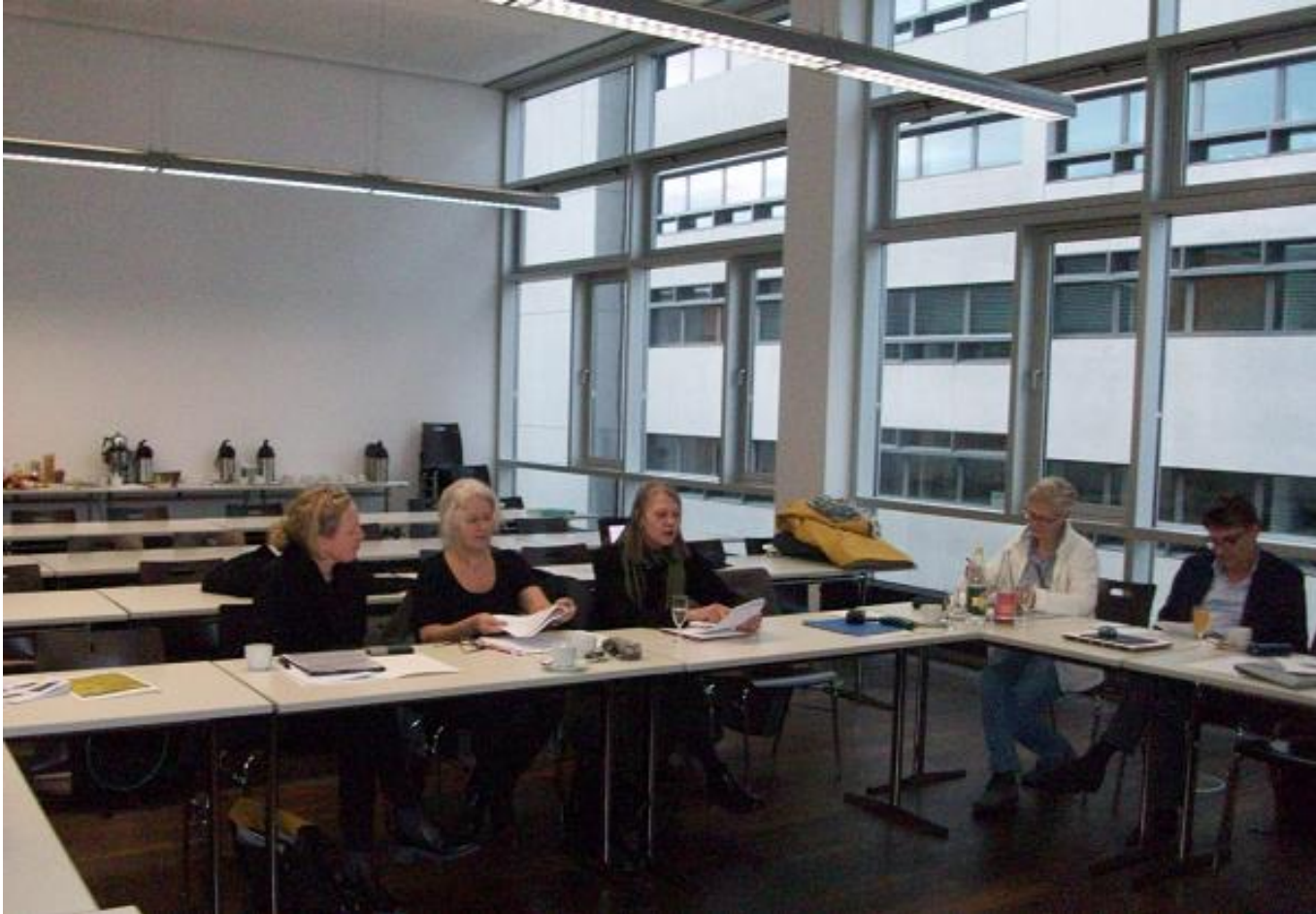
Beiräte der DGS