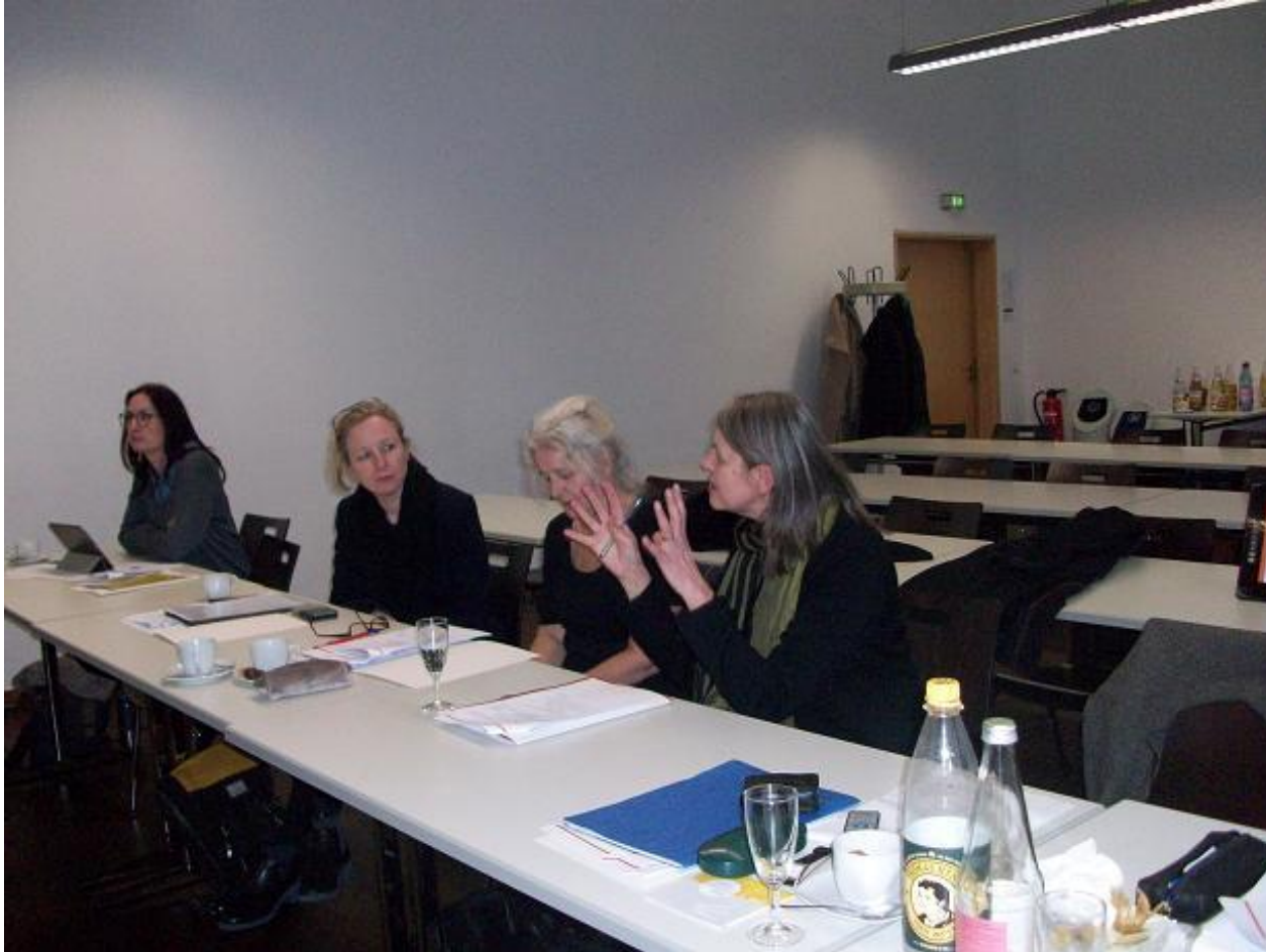
Die schöpferische Diskussion