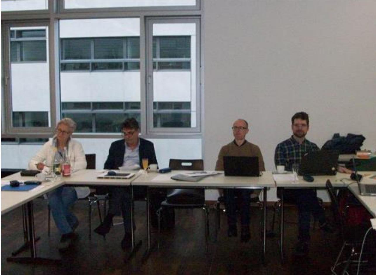
Beiräte der DGS