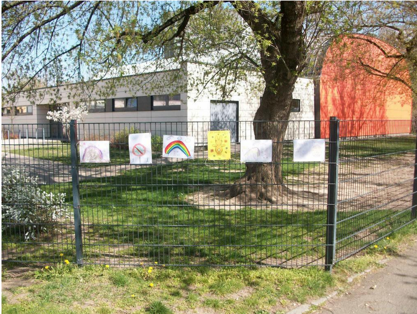
Kinderbilderausstellung am Zaun – die Kita ist geschlossen