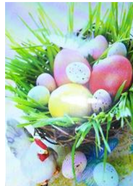
Viktor & Soja