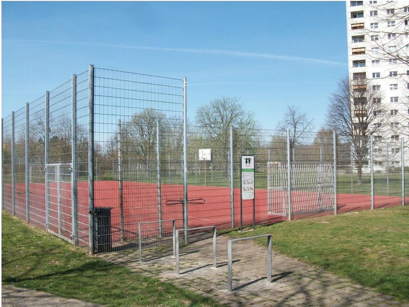
Sportplatz – kein Training auf dem Sportplatz