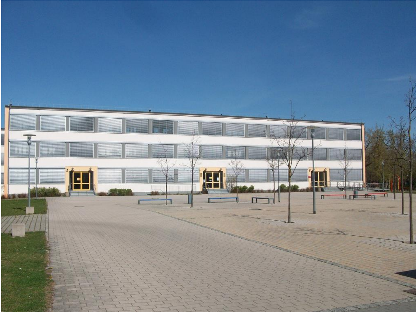
Die Schule – verwaist und geschlossen