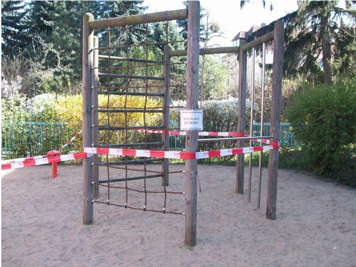
Spielplatz für Kinder im „Corona-Modus“