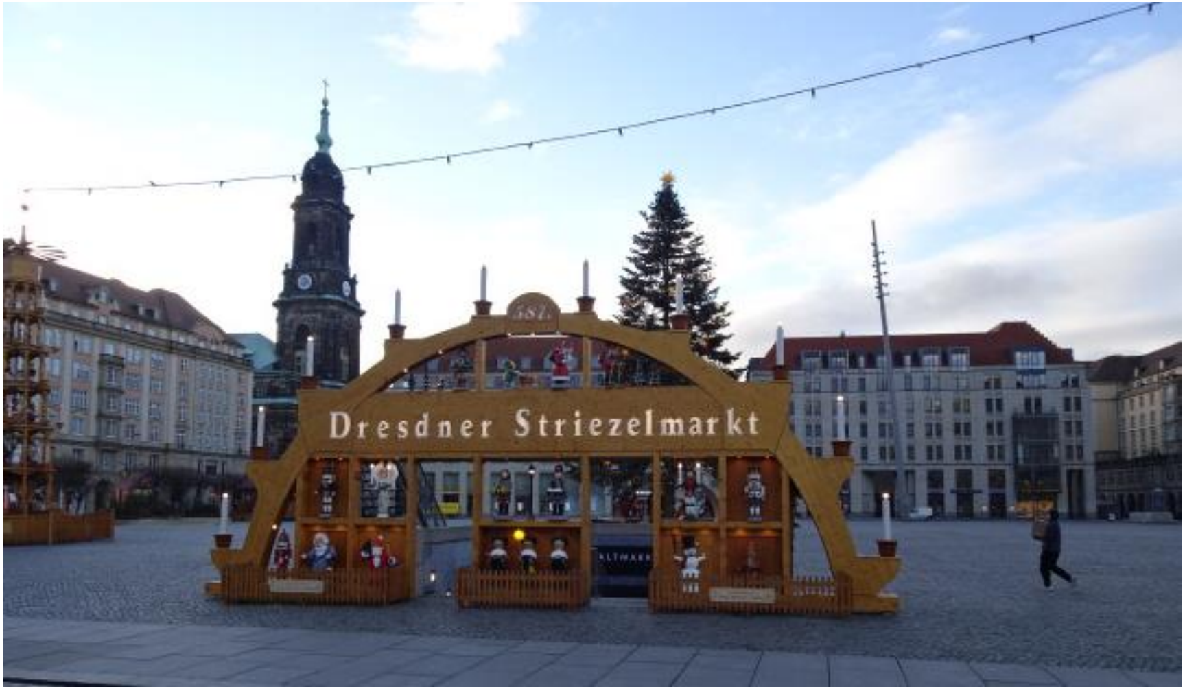
Der traditionelle Schwibbogen steht verloren auf dem Altmarkt