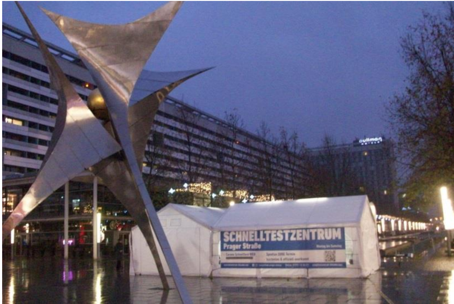
Schnelltestzentrum auf der Prager Straße