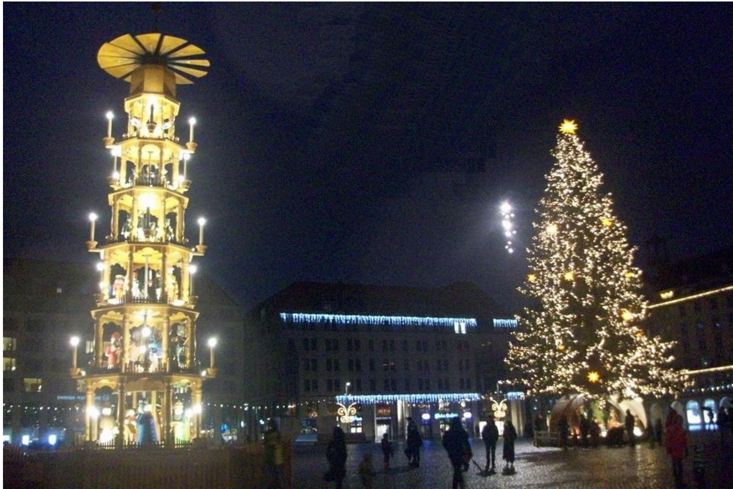
Weihnachtspyramide und Weihnachtsbaum 2021 am Adventsabend