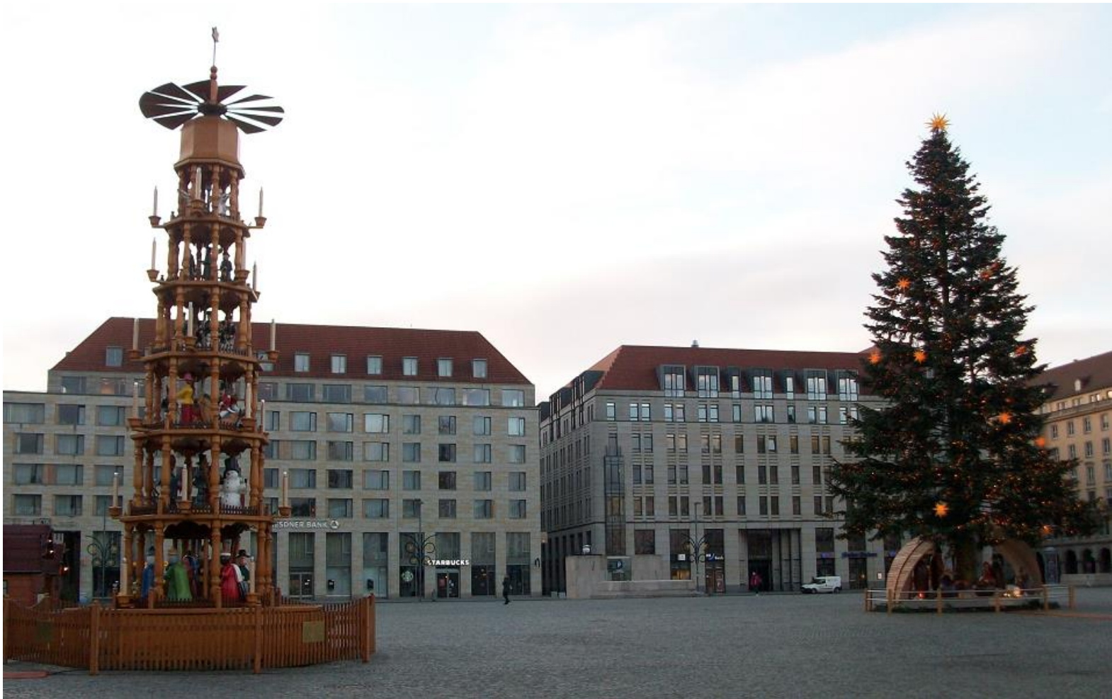
Weihnachtspyramide und Weihnachtsbaum 2021 am Adventssonntag