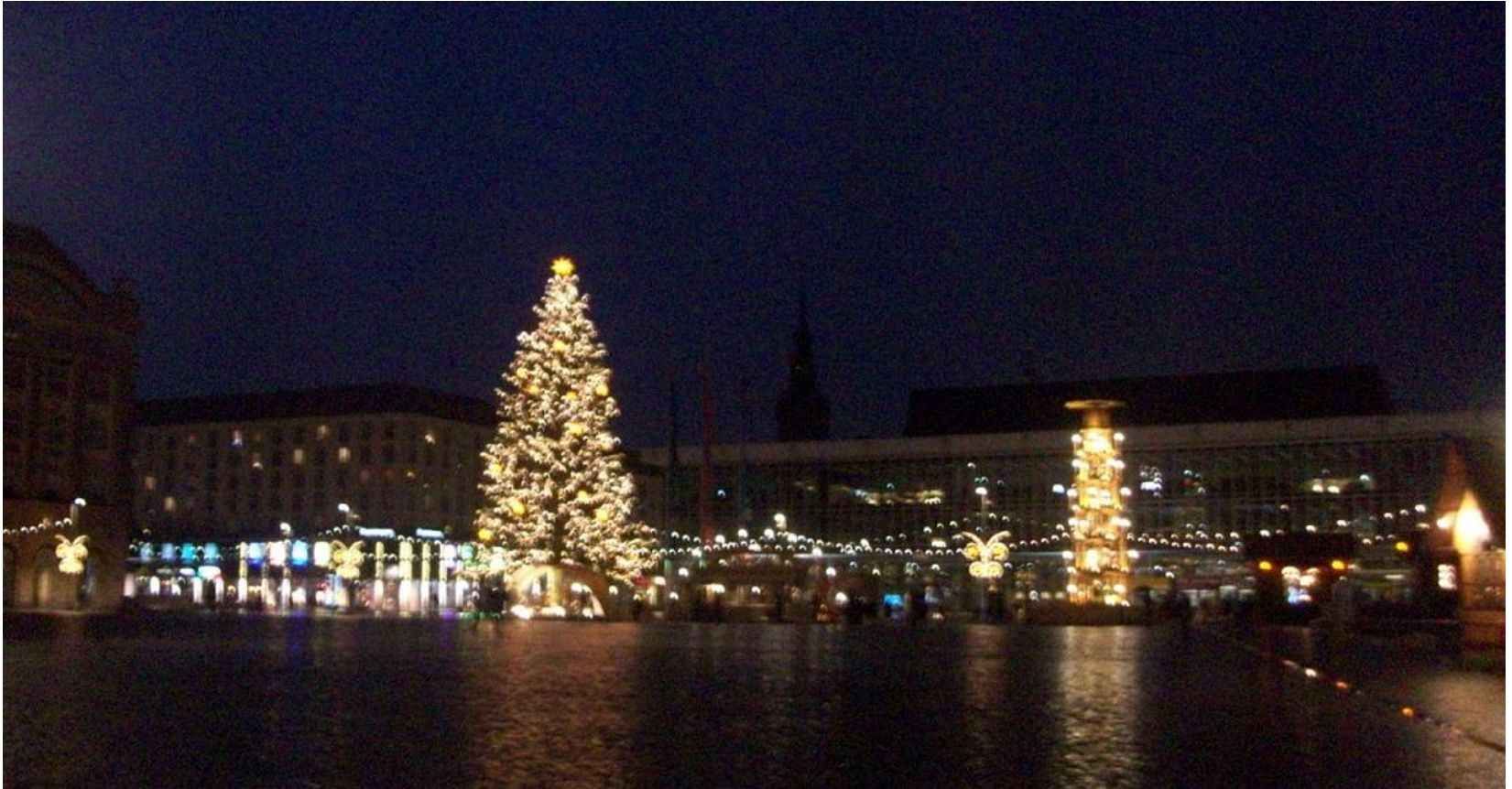
Altmarkt am Adventsabend