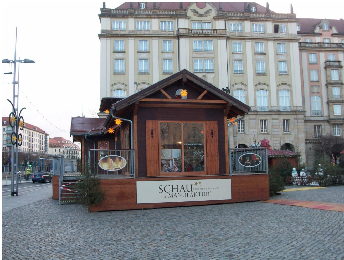
Traditionelle Schau-Manufaktur für den Dresdner Christstollen