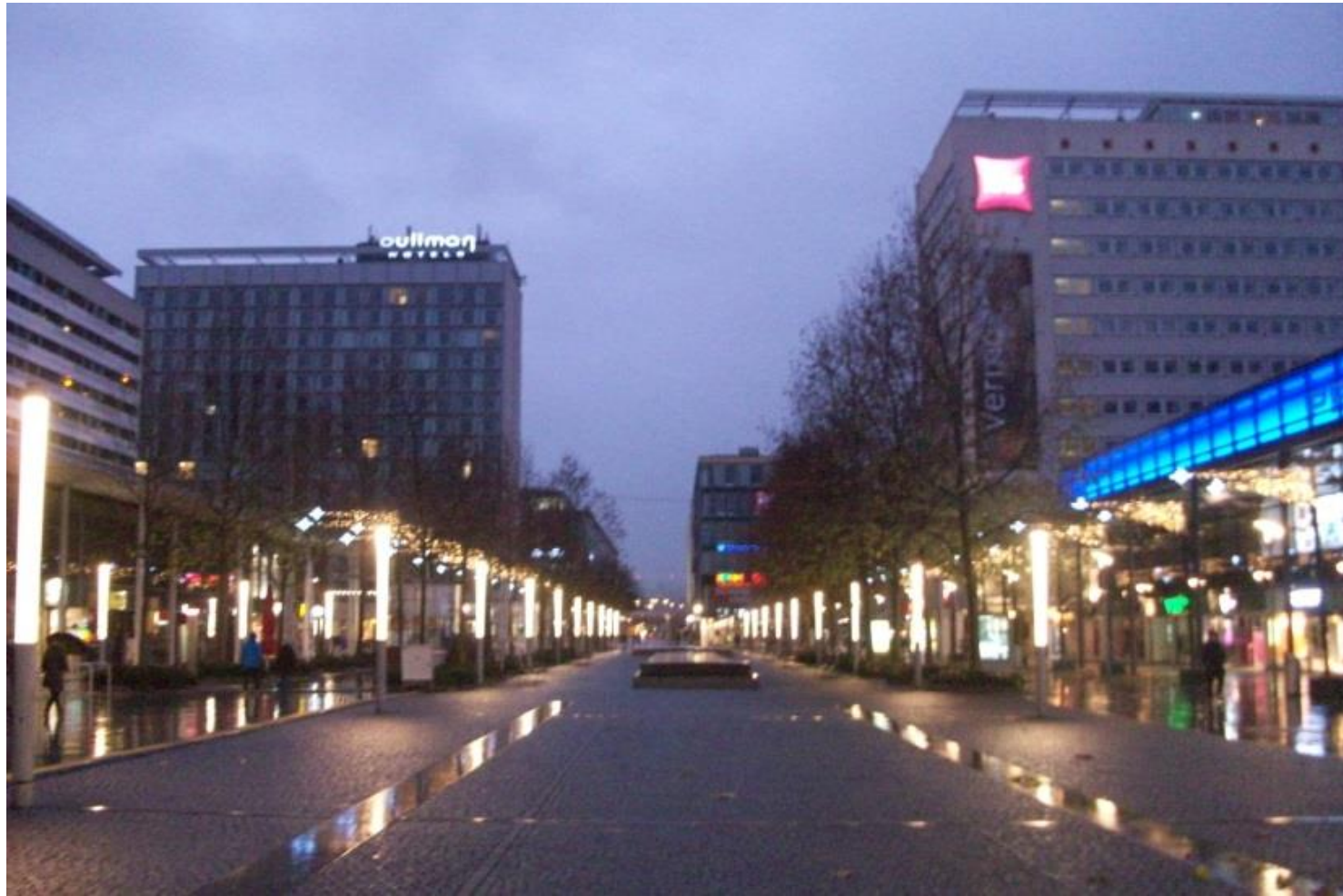
Leere Prager Straße