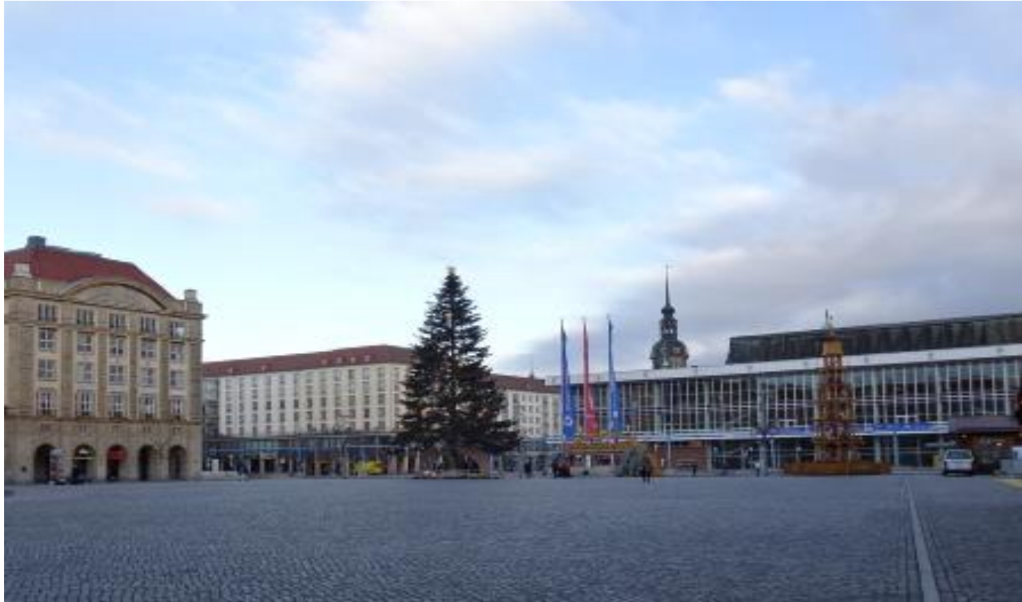
Altmarkt am Adventssonntag