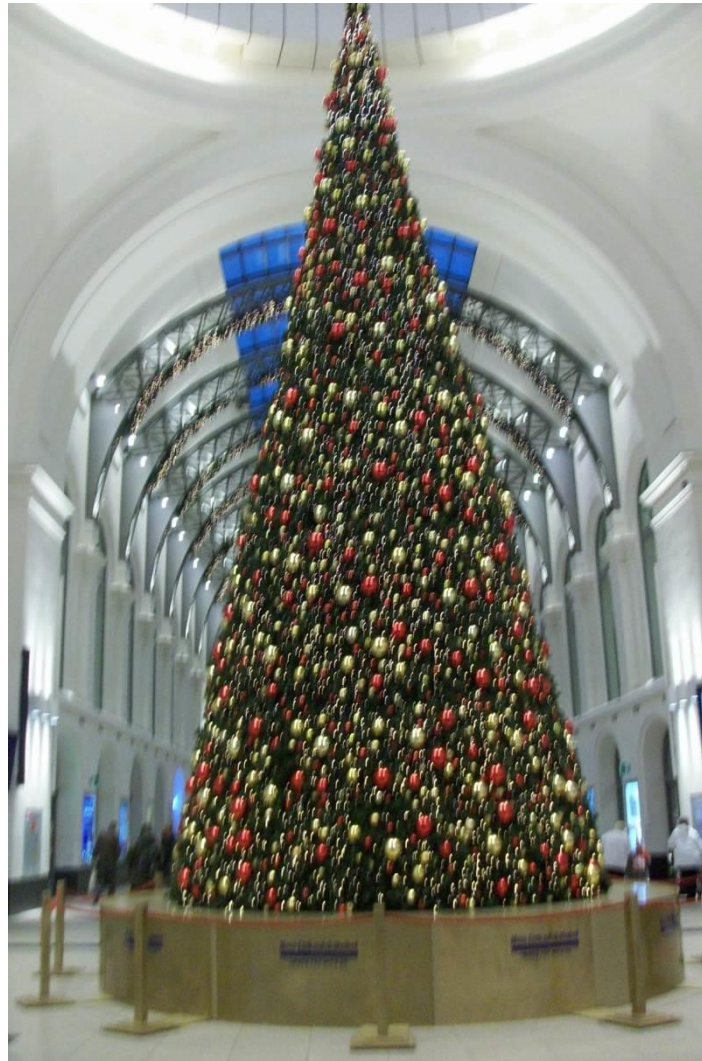
Weihnachtsbaum am Hauptbahnhof