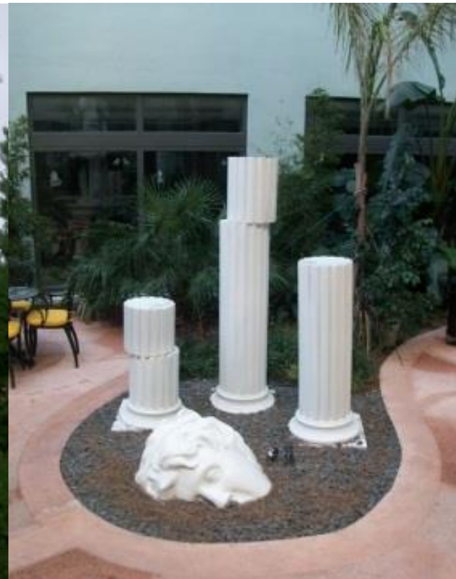
В парке отеля «Atlantis»