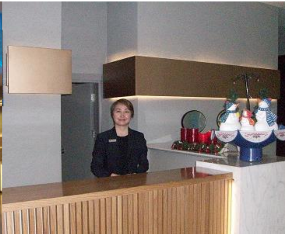
В отеле «Atlantis»