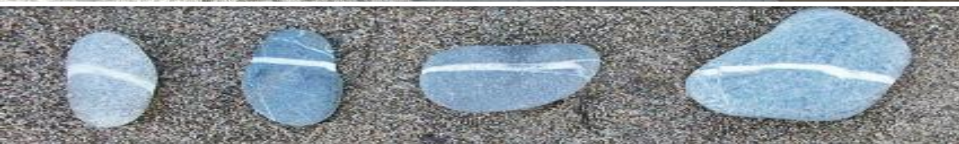
Линейные элементы (а)