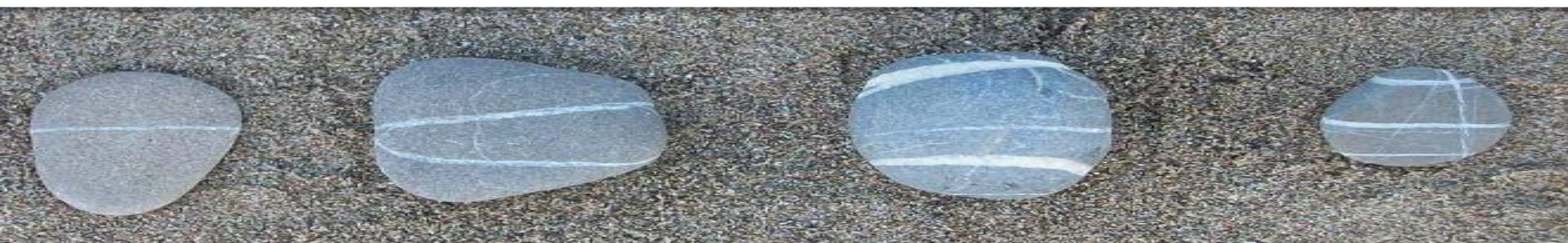
Линейные элементы (б)