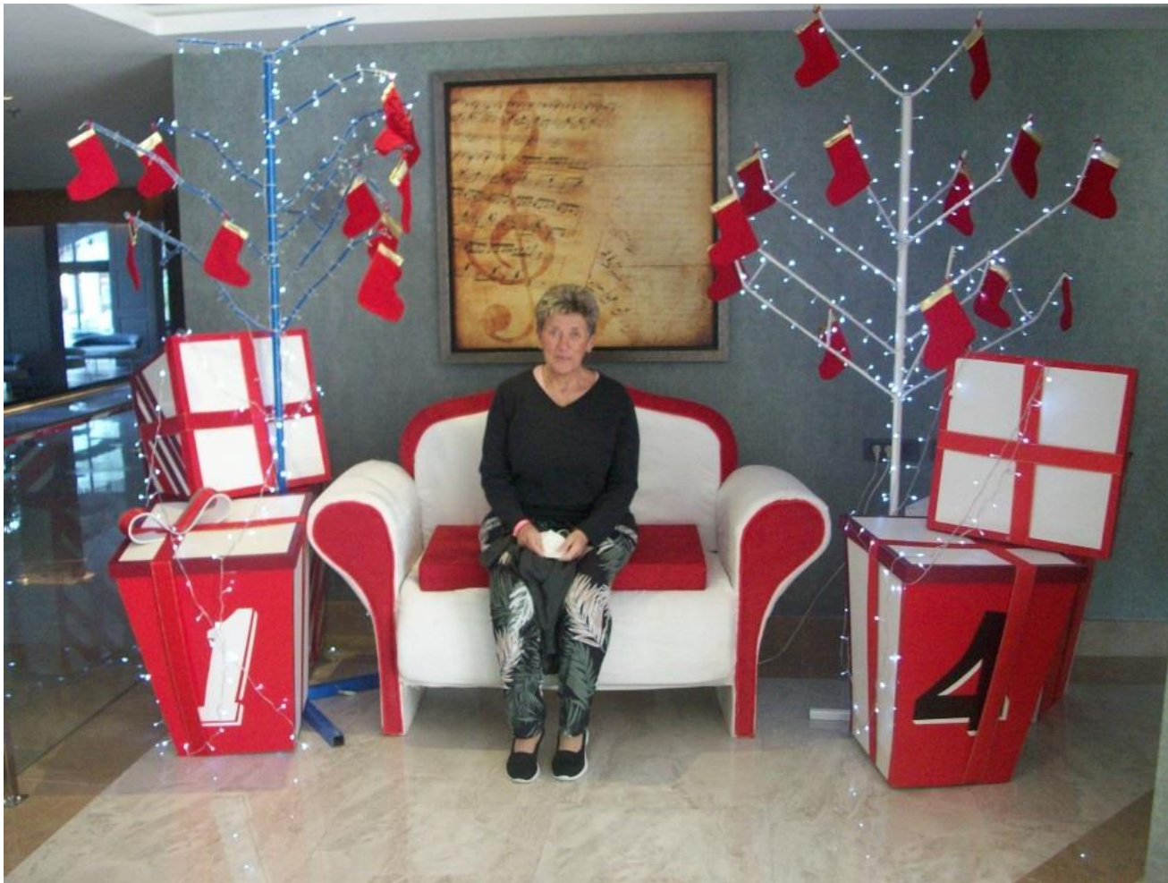
Особый адвент-календарь для гостей отеля