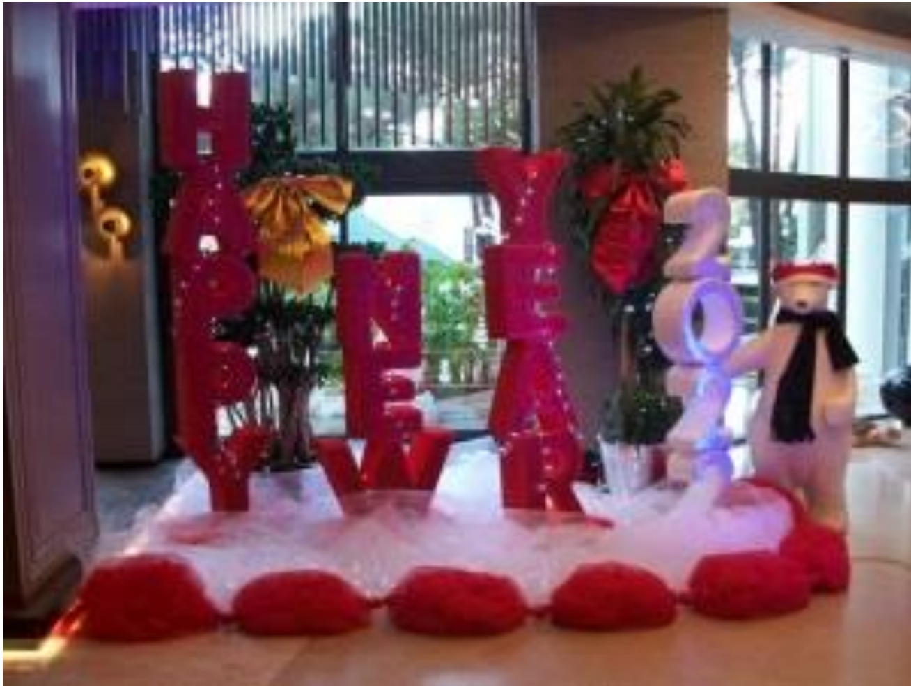
Новогодние украшения в отеле