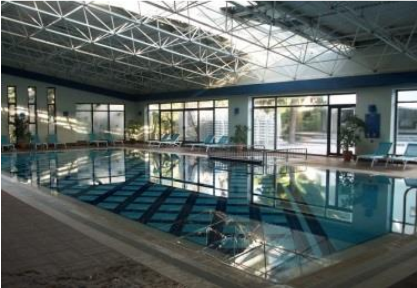
В плавательном бассейне