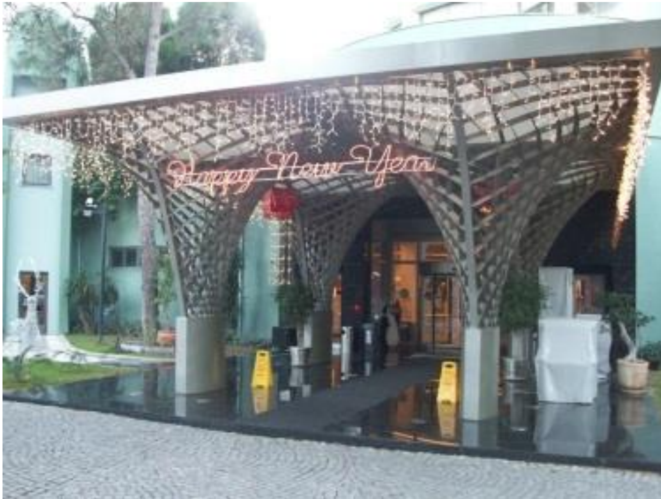
Главный вход в отель «Atlantis»